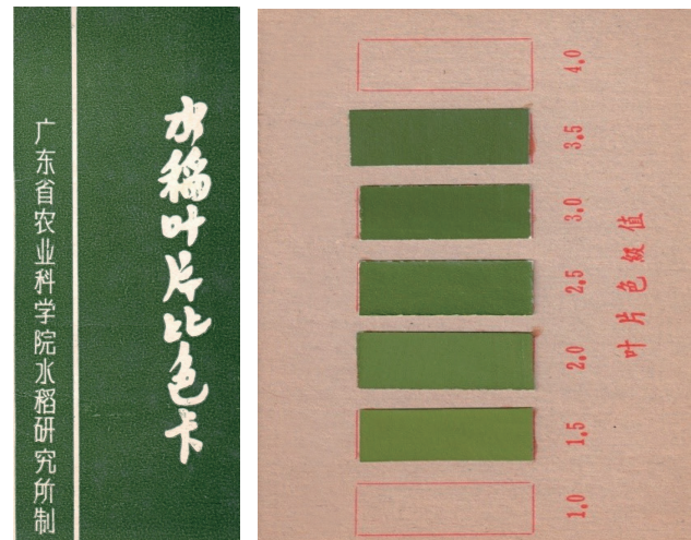
图1 水稻叶片比色卡

传统的移栽稻以手插秧为主,劳动强度大,劳动成本高。随着改革开放和社会经济的发展,农村劳动力大量向城市转移,迫切需要水稻轻简化栽培技术。水稻抛秧是用预制的纸筒或塑料盘装载营养土育秧,利用营养土块的重力作用,把育成的秧苗